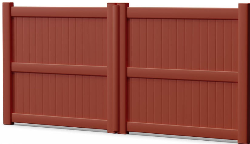
Modèle présenté : Gamme Séduction - Style classique