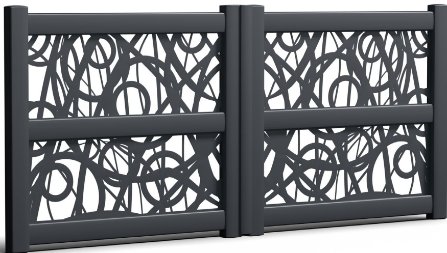
Modèle présenté : Gamme Séduction - Style décoratif