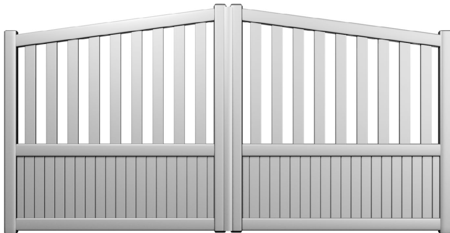
Modèle présenté : Gamme Séduction - Style classique