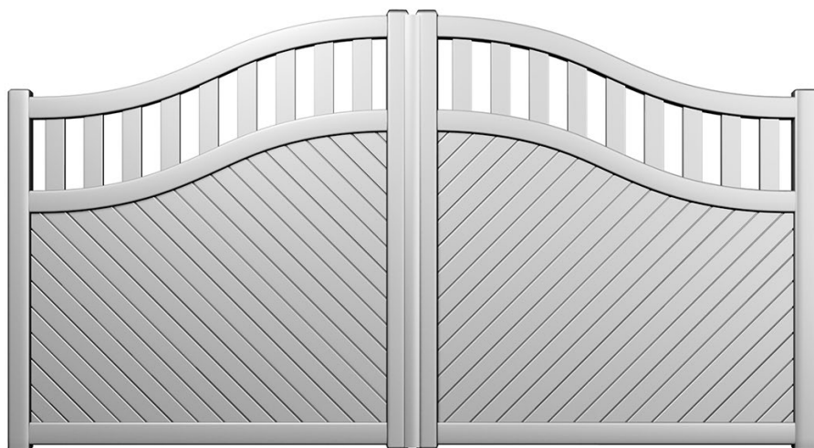
Modèle présenté : Gamme Séduction - Style classique